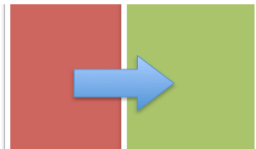
轉換觀點重新看待行為